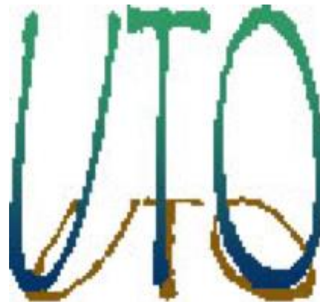
Unité de Traitement de l'Oedème périphérique